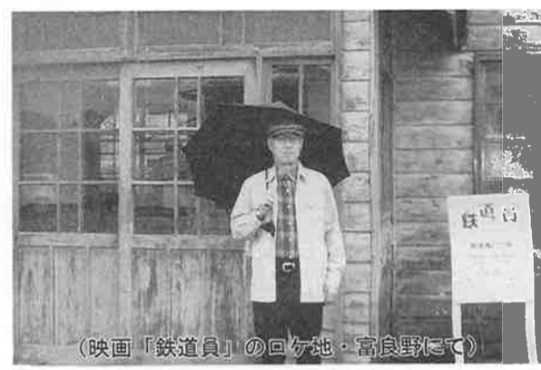
(映画「鉄道員」のロケ地・富良野にて)

昨年10月より業務を開始した日本司法支援センターは「法テラス」といわれる。「法で社会を照らす」というねがいがこめられている。私はその千葉地方事務所長。「法」のなかで最も大切な法こそ最高法規としての日本国憲法だ。「法テラス」から今日のこの国の社会をみると、そこには「格差社会」に呻吟する大勢の人がいる。その「期待」にこたえるのは容易ではない。日本国憲法のこのころを政治や社会のルールとして生かすことの大切さを痛感する毎日だ。今年も三足の草鞋をはいて、元氣。「憲法」、「法テラス」、「事件活動」。今年も三足の草鞋をはいて、元氣にやりたいと思う。そして、時には気ままな「旅」にでられ、おいしい地酒にめぐり合えれば、こんな幸せはないときっと思うにちがいない。「9条改憲」それは、庶民のこんなささやかなねがいがいすら奪うことになりかねない。戦争というものはそういうものだからだ。